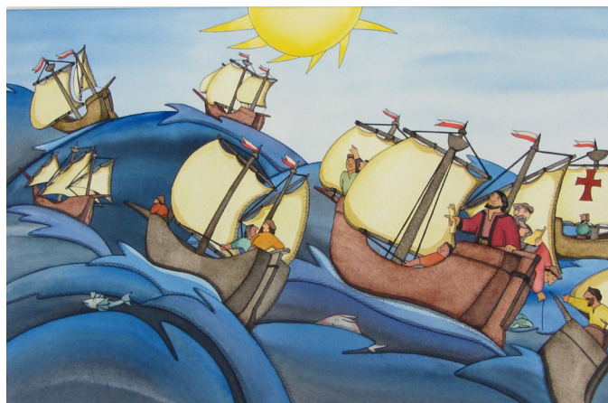
Couverture de Letizia Galli All pigs on deck , texte Laura Fischetto, Bantam Doubleday Dell, 1991 crayon et aquarelle sur papier Arches, coll. mij